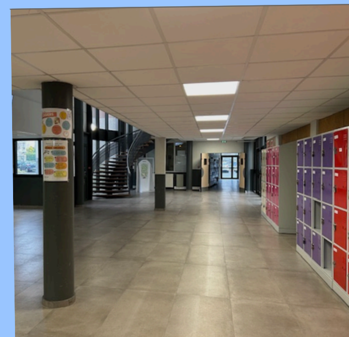
HALL ET CASIERS