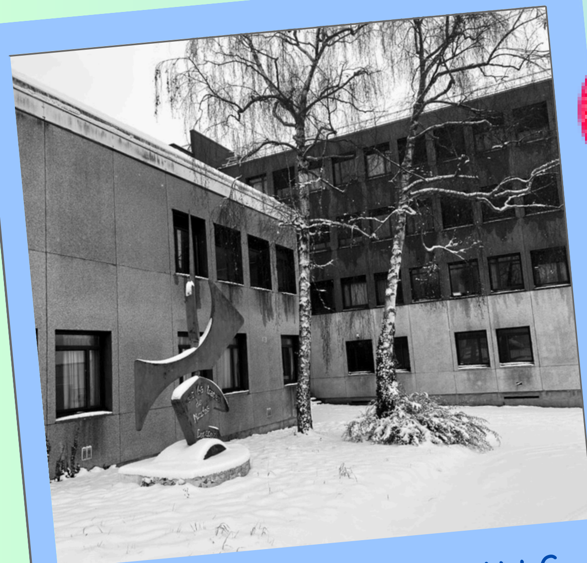
COLLÈGE COPERNIC MONTMAGNY